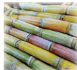
サトウキビスクワラン